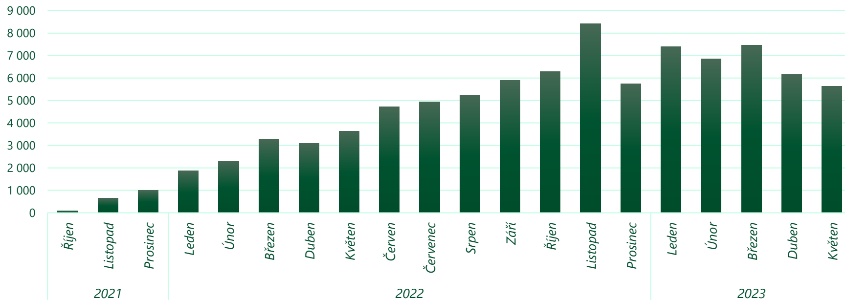
Zájem o FV systémy